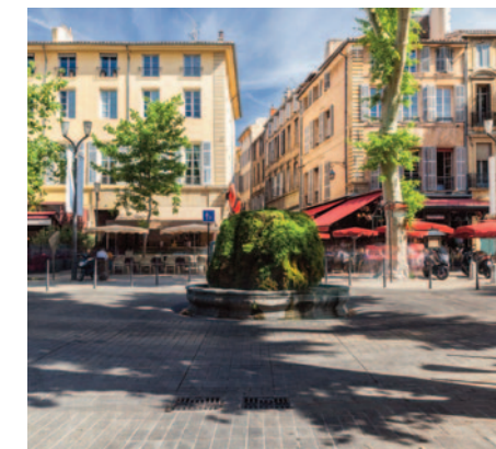
Le Cours Mirabeau