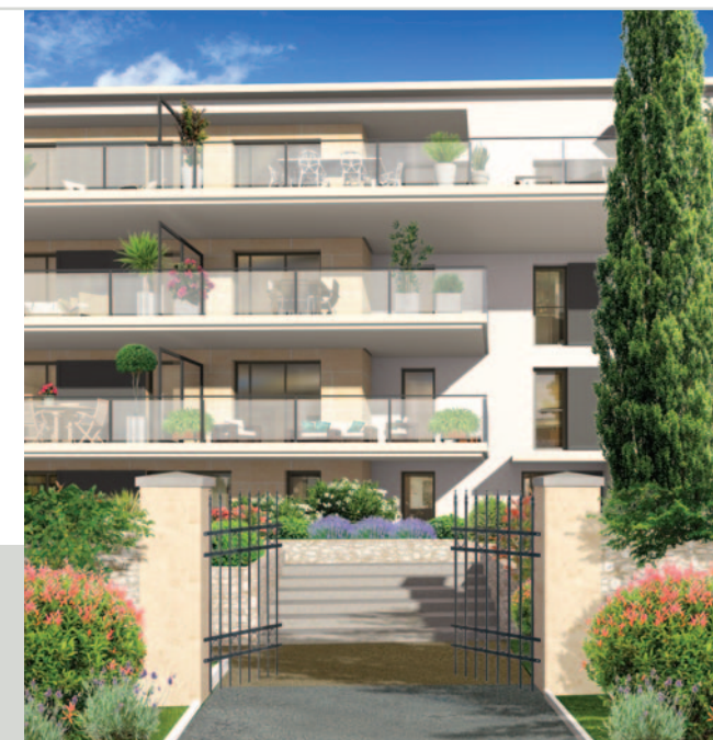
Illustrations à caractère d'ambiance

Les appartements du 2 au 5 pièces sont fonctionnels, spacieux et offrent de véritables espaces de vie. Les espaces extérieurs vous feront profiter de belles journées ensoleillées en famille ou entre amis.