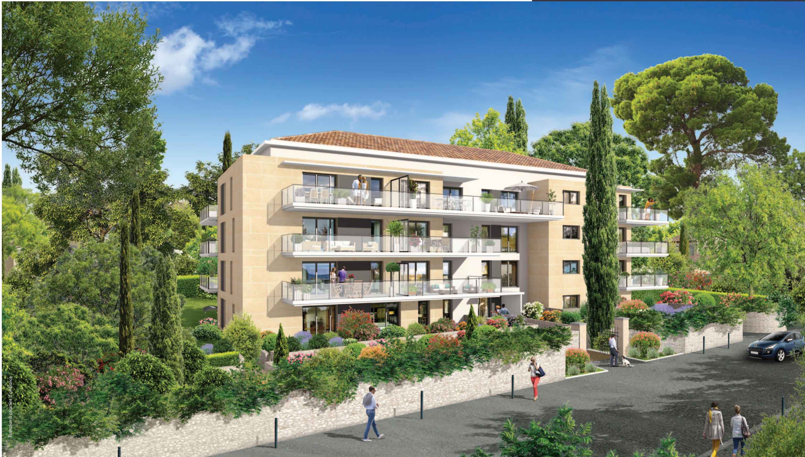
Illustration à caractère d'émulation