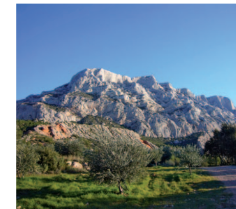
La Sainte Victoire