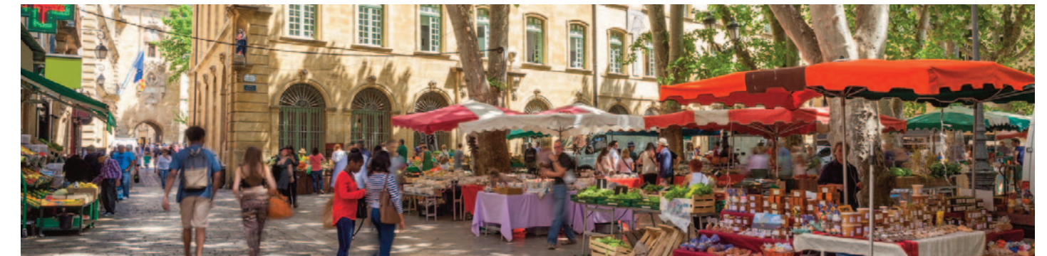
Le marché place de la mairie

Tout près, la place de l'Hôtel de Ville au charme Toscan vous offre son luxuriant marché aux fleurs, la place Richelme animée de commerces aux mille parfums et saveurs, celui des quatre saisons. Devant le Palais de Justice, chinez les puces et les bouquinistes. Puis dans les rues piétonnes, passez de la joyeuse animation de commerces et artisans au raffinement des enseignes de griffes de luxe.