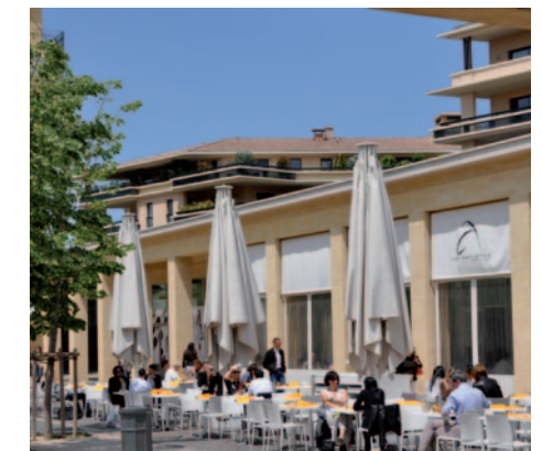
Les Allées Provençales

À quelques pas des paysages de Cézanne et à dix minutes à pied du Cours Mirabeau